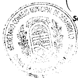
Secretario Municipal Secretario del COMUDE